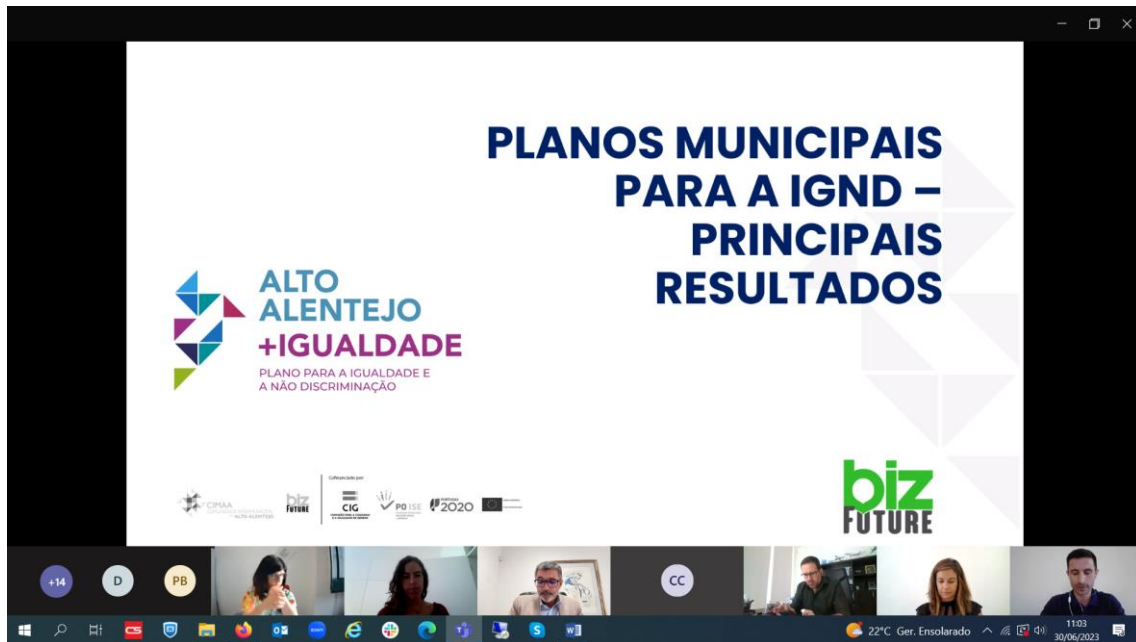
Figura 6 - Evidências do Seminário Alto Alentejo + Igualdade