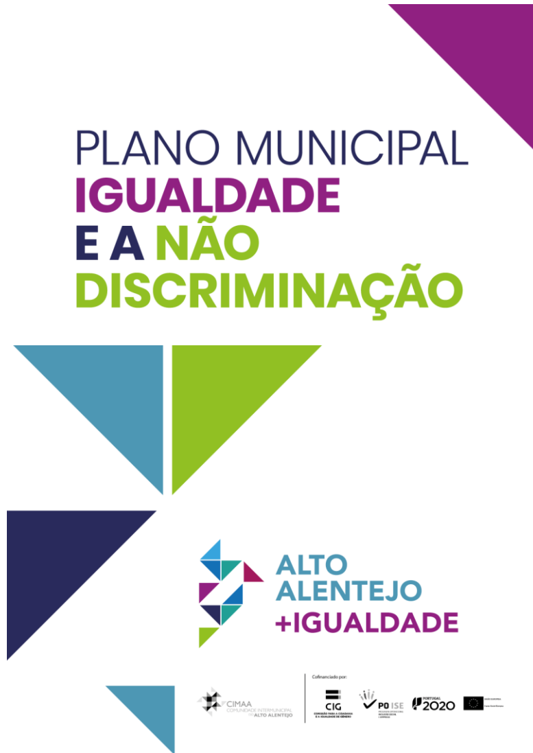
Figura 4 – Poster de divulgação do PMIND