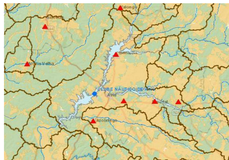
Figura 2 - Ocupação do solo na bacia drenante à água balnear Figure 2 - Map of the catchment draining into the bathing water